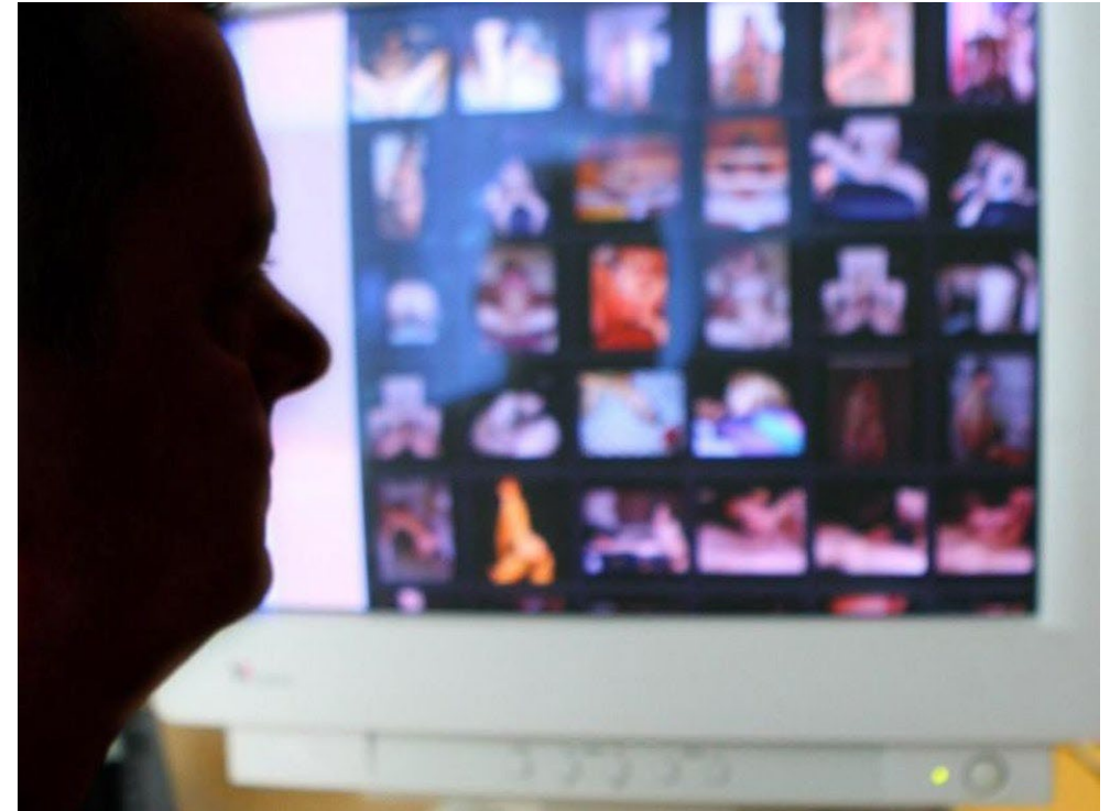
Austausch von Bildern und Videos